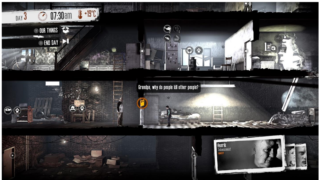
Image 2. This War of Mine.

L'objectif des élèves est simple : terminer le jeu. Cela devrait prendre 2 à 3 heures. Comme ils jouent individuellement dans la salle de classe, ils doivent noter certaines des étapes importantes qu'ils ont franchies dans le jeu et quelle partie a eu l'impact le plus significatif sur eux. Précisez dès le début que vous discuterez ensemble de leurs notes et que vous aurez une brève séance de débriefing sur leurs opinions après le jeu.