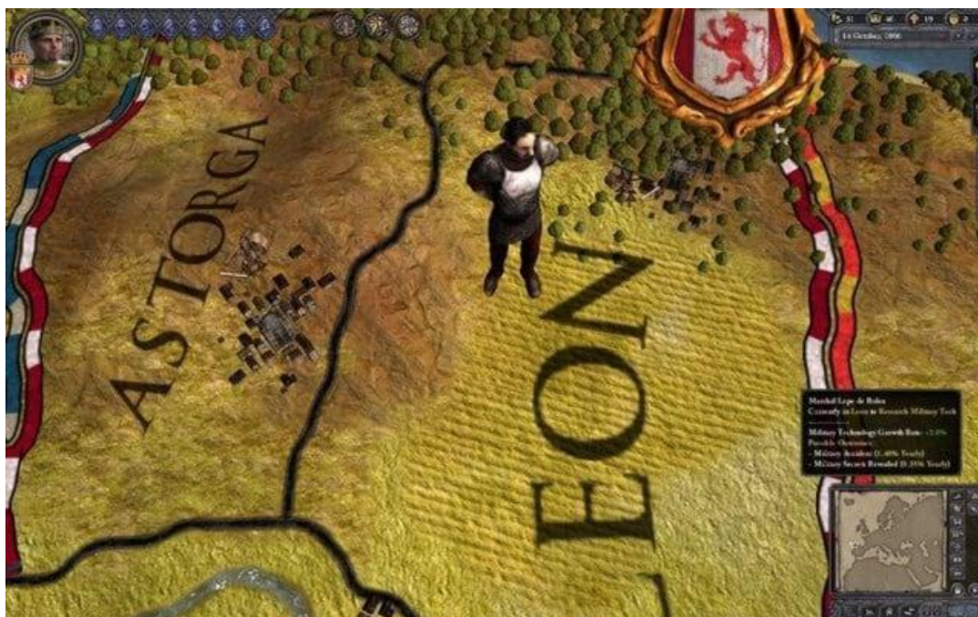
Imaginea 2: Crusader Kings 2.