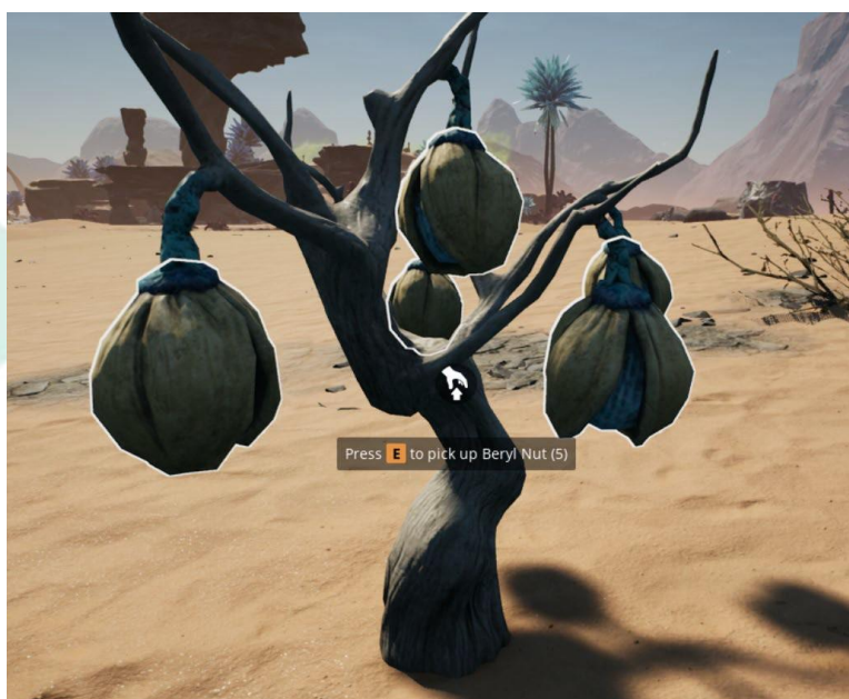
Figura 3. Instantaneu cu fructe de pădure ("Satisfactory", Coffee Stain Studios, 2020)

De asemenea, sunt furnizate alimente (în cantități limitate), în principal în scopuri de vindecare.